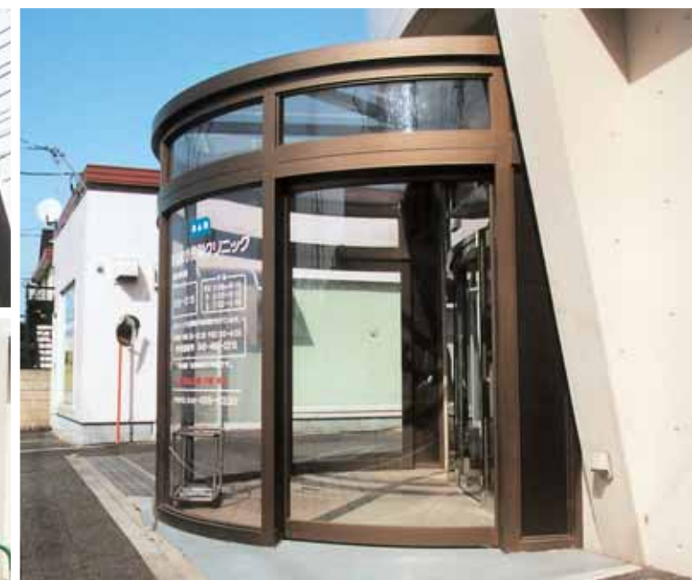
病院玄関風除室 (埼玉県新庄市 病院)