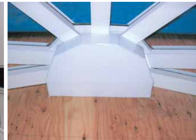
コンサバトリー調! (神奈川県茅ヶ崎市 I様邸)