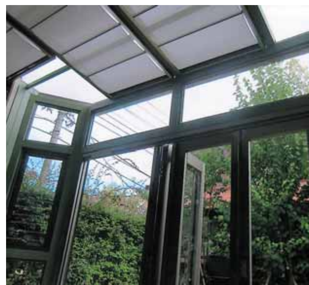
台形型 (東京都町田市 M様邸)