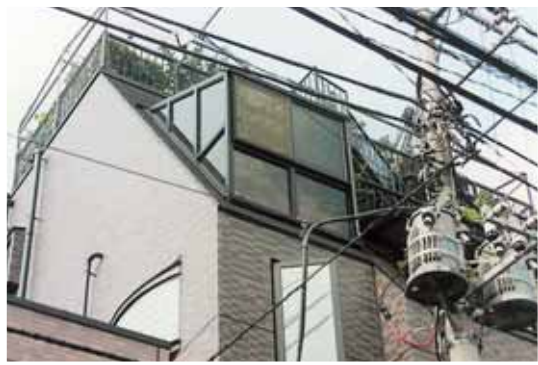
フラット 4連棟施工