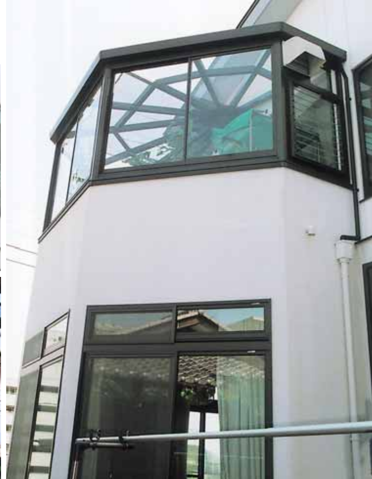
(神奈川県横須賀市)