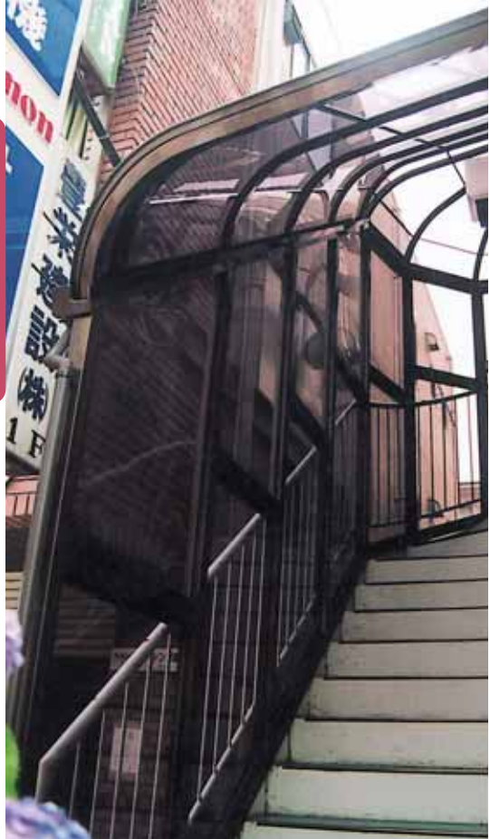
外階段アールやね