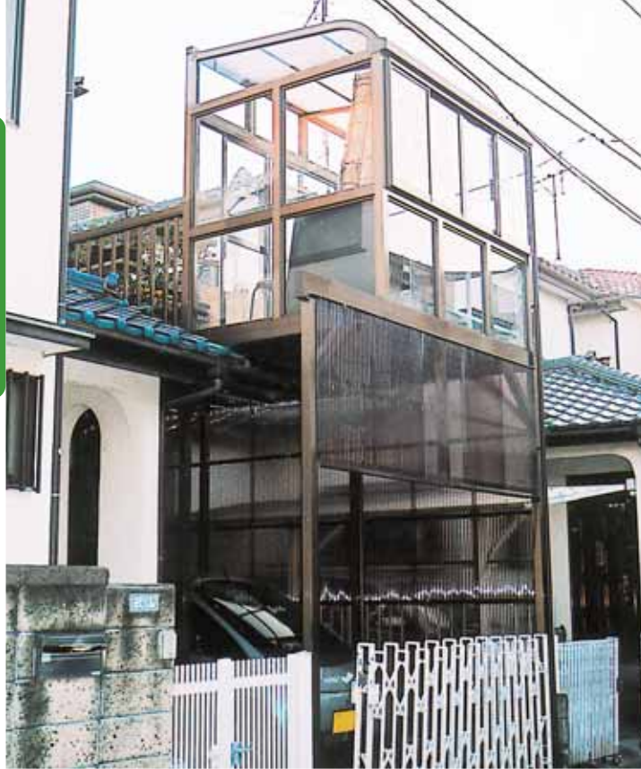
(埼玉県上尾市 A様邸)