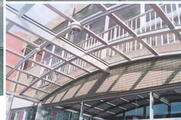
玄関風除室 (埼玉県川越市 藤原白百合幼稚園) [間口:5.5M、奥行:3.0M、被覆材:ポリカーボネート板 t-3.0、5.0(耐候処理)、 アルミ複合板t-3.0]