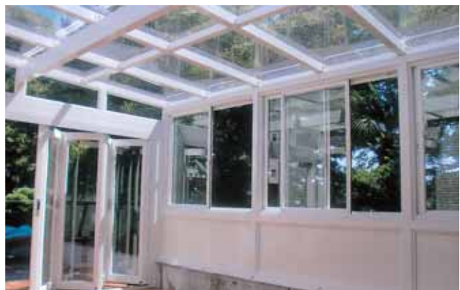
(東京都港区 C大使館) [出巾:4.0M、間口:6.5M、屋根材:ポリカーボネート板+-5.0(耐候処理) 折り戸仕様]