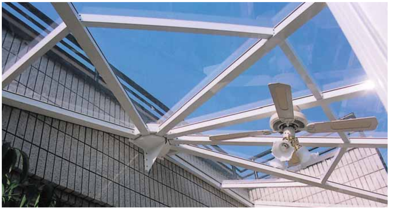
コンサバトリー調! (東京都渋谷区 T様邸)