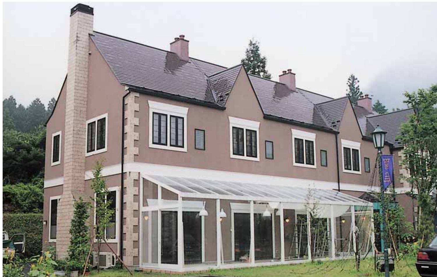
(栃木県日光市 レストラン) [軒高:H3.4M、出巾:2.7M、間口:7.2M、被覆材:t-6.8 網入りトーマイ PHW]