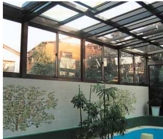
小プール開い [仕様=天井電動開閉式]