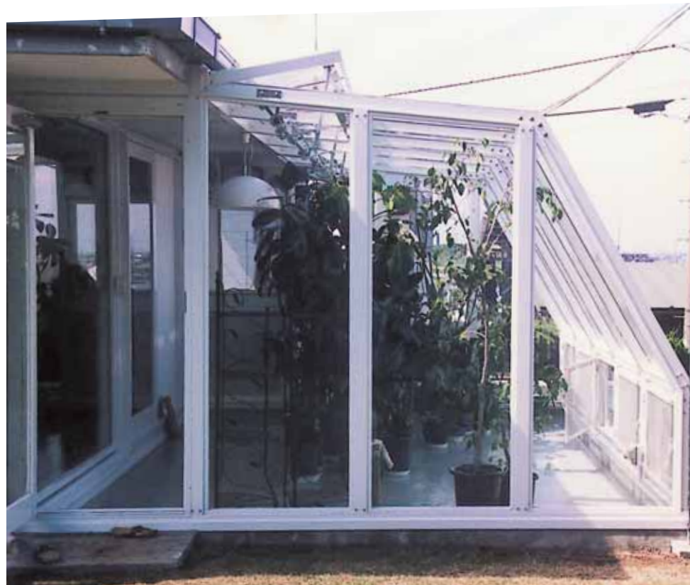
[仕様=天窓開閉・風センサー・雨センサー・温度センサー]