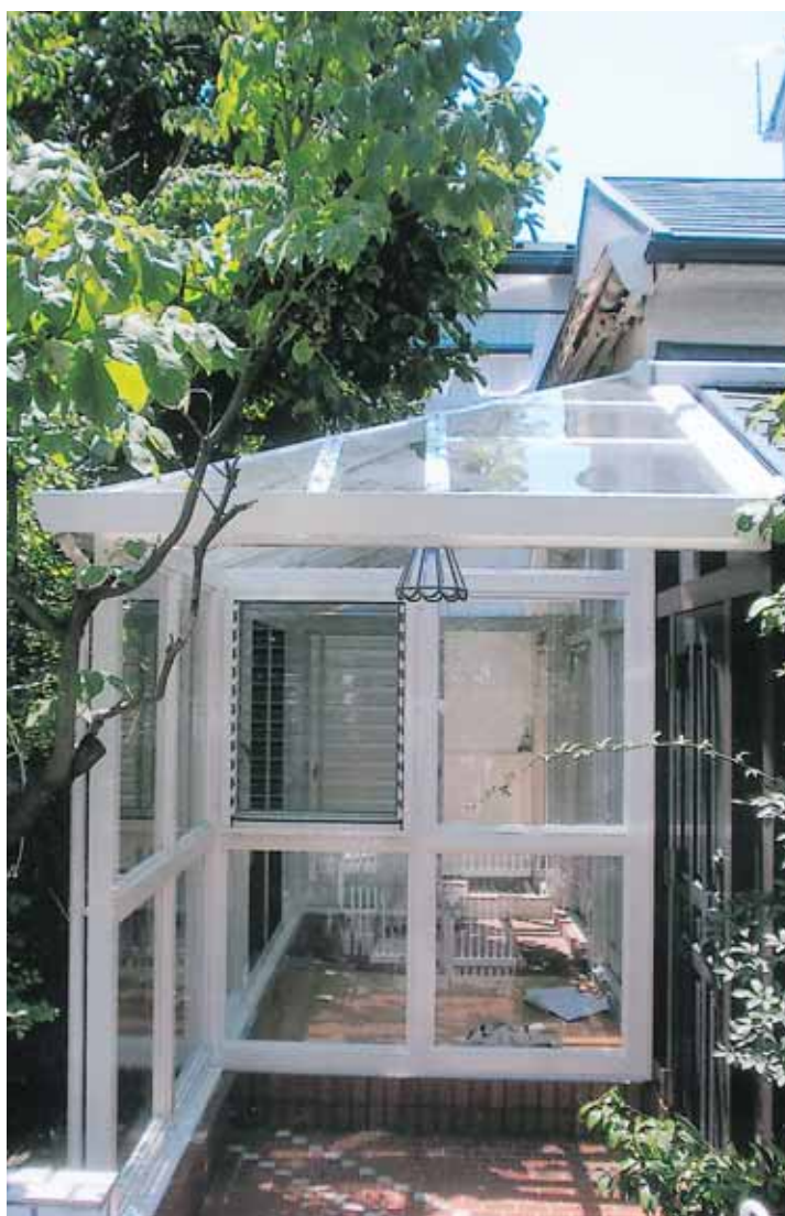
寄棟風テラス囲い(屋根材:PHW) (埼玉県川口市 U様邸)