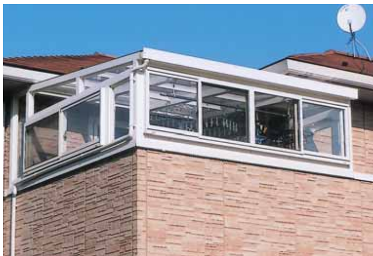
(茨城県阿見町 F様邸)