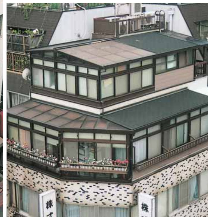
(東京都中央区馬喰町)