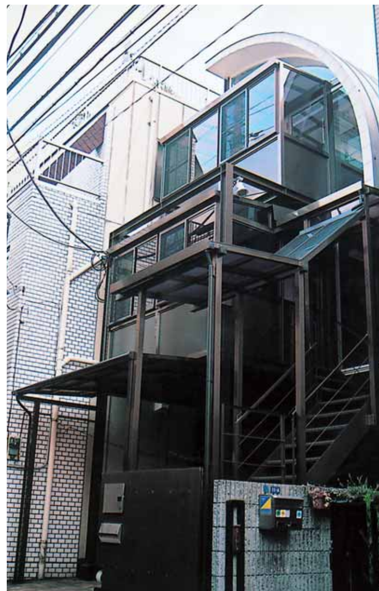
フラット型2段テラス囲い+フラット階段やね!