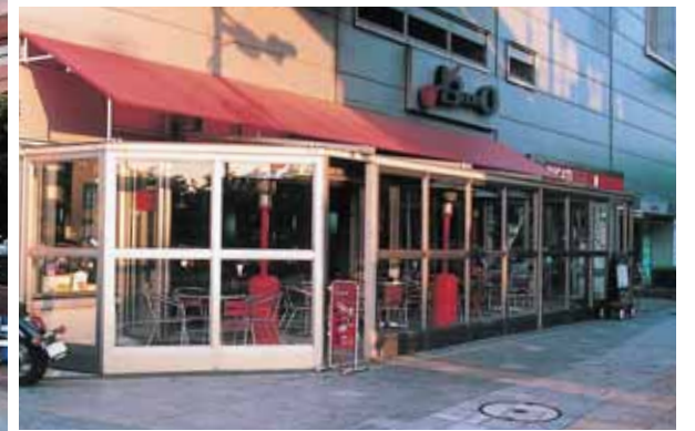
(東京都港区お台場 Bカフェテラス)