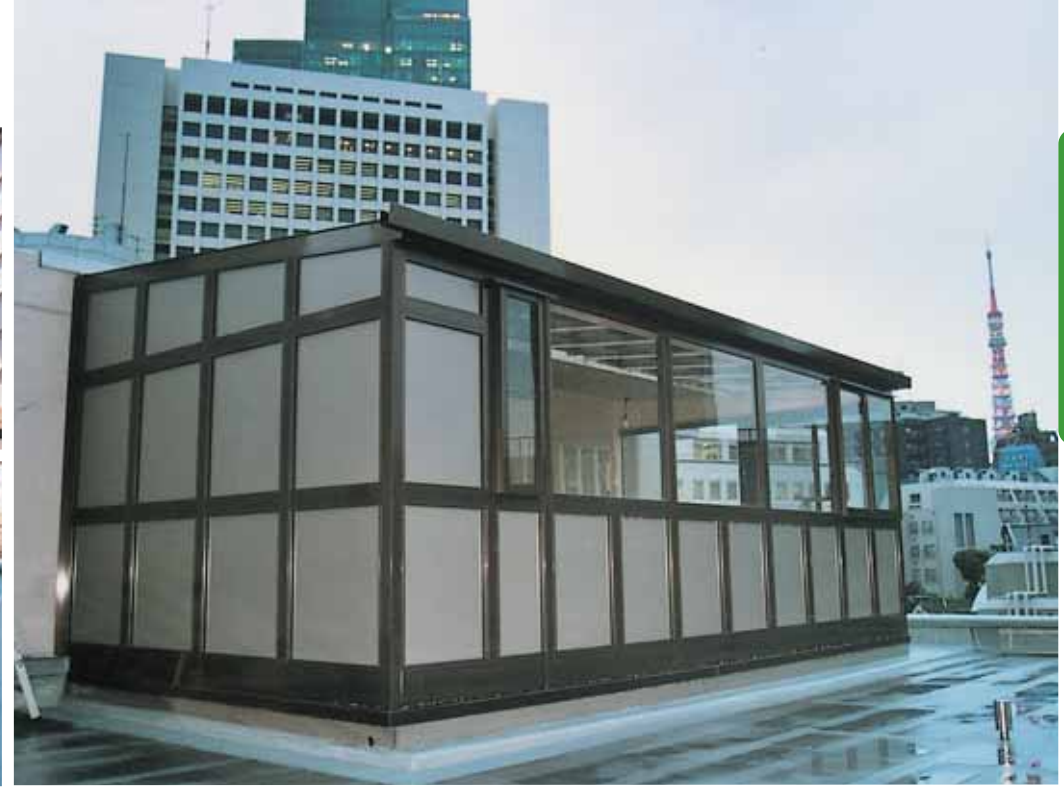
8階屋上 (東京都港区六本木 Nビル) [出巾:3.5M、間口:7.5M、屋根材:ポリカーボネート板+-6.0、側面材:アルミ複合板+-3.0]