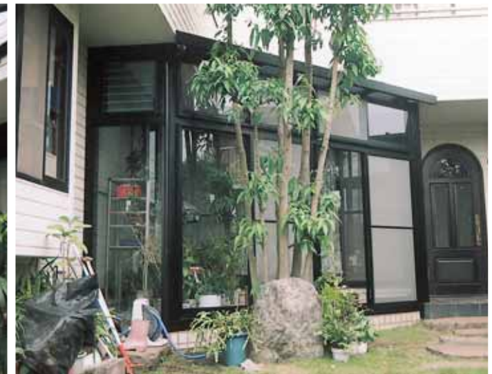
(神奈川県横須賀市)