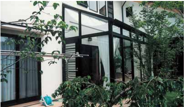
[軒高:H3000、屋根勾配=母屋屋根勾配、ガラス全て強化ガラス、TP]