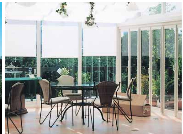
(東京都渋谷区原宿 東郷記念館 結婚式場) [出巾:3.6M、間口:9.5M、被覆材:t-10 トーマイガラス]