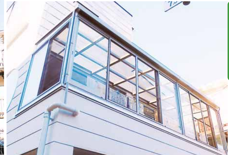
やさしい光が注ぎ込む、うれしい空間が広がります!